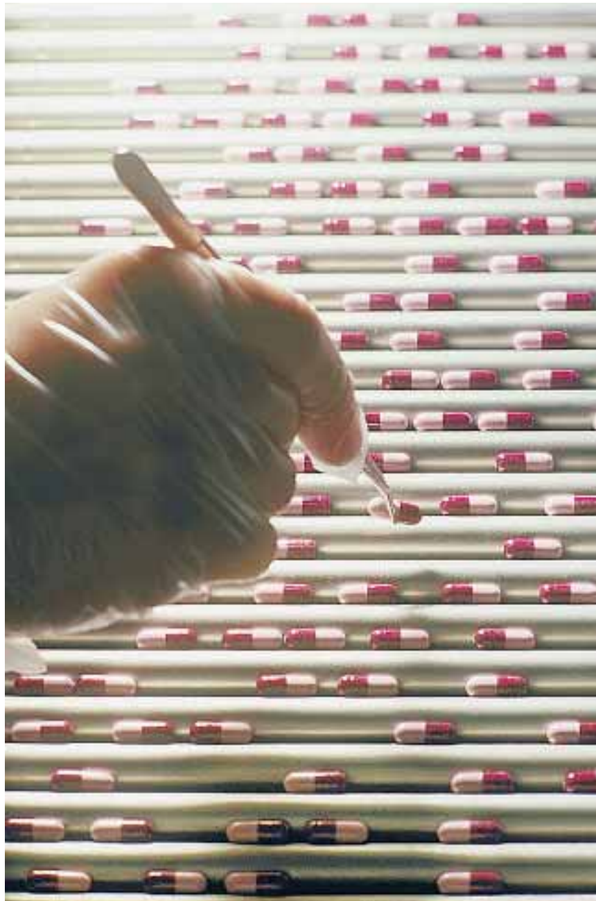
Gesicherter Ausstoss: Deutsche Pharmafirmen haben keine Patentablauf-Sorgen.

Die Agentur Moody's sieht die Unternehmen AstraZeneca, Takeda, Bristol-Myers, Pfizer, Sanofi-Aventis, Glaxo Smith Kline und Merck in besonderer Masse vom Problem des Patentausfalls betroffen – und zwar in dieser Reihenfolge. Ebenfalls, wenn auch in geringem Ausmass beeinträchtigt sind laut den Analytikern Novo Nordisk, Novartis, Abbott, Roche, Amgen, Biogen so-